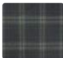
ボトムは 紺×グレー×グリーン

ボトムはスラックスI型、スカート、スラックスII型から選ぶことができます。(I型・II型はシルエットが異なります)